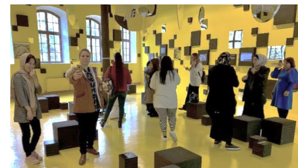
Exkursion ins Museum Arbeitswelt Steyr